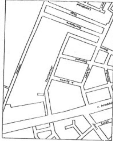
PLAN DE INCADRARE IN ZONA SC. 1/1000